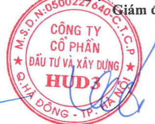
Vương Đăng Phương