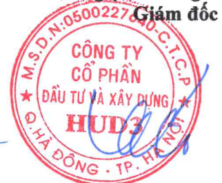
Vương Đăng Phương